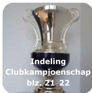
Indeling Clubkampioenschap blz. 21-22