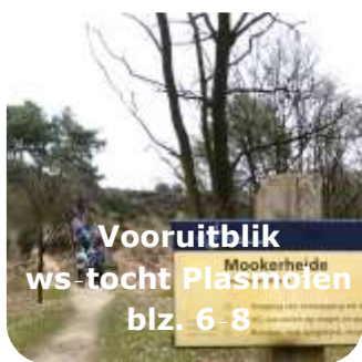
Vooruitblik Mookerheide ws-tocht Plasmolen blz. 6-8