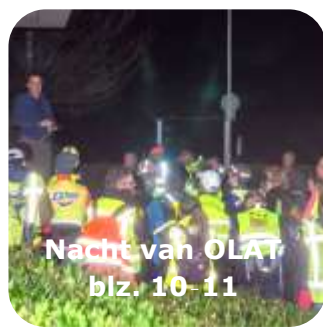
Nacht van OLAT blz. 10-11