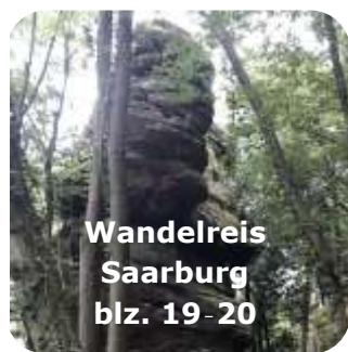
Wandelreis Saarburg blz. 19-20