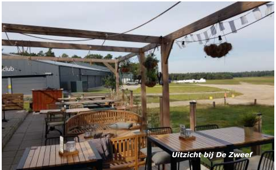
Uitzicht bij De Zweep

Een volgende bezienswaardigheid nadert. We komen op Landgoed Mookerheide met het prachtige jachtslot dat meer dan 100 jaar geleden in jugendstil gebouwd werd. Aan de voorzijde lag een rozentuin en een vijver met fontein en een ijskelder. Hier werd het ijs uit de winter opgeslagen zodat de bewoners deze kelder konden gebruiken als koelkast. Tussen 1947 en 1985 was het complex in eigendom van de Zusters van Dominicanessen van Bethanië. Natuurmonumenten heeft het jachtslot met tuinen en